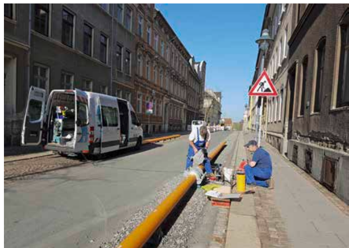
Die Stadtwerke-Monteur bereiten die Gasrohre für die Verlegung in den Rohrgraben vor.