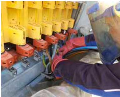
Die Monteure der Stadtwerke beim Abtrennen der alten Kabel (großes Foto) sowie beim Anbinden der Kabel an die neue Trafostation (kleines Foto).

Mit regionalen Graffiti-Motiven werden Trafohäuschen auf Vordermann gebracht.