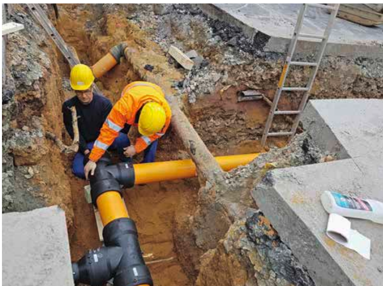
Seit Wochen werden im Auftrag der Stadtwerke Reichenbach neue Gasleitungen verlegt. Das Bausgeschehen ist mit umfangreichen Tiefbauarbeiten verbunden.

DIE ERSTEN METER der neuen Gasleitung sind bereits verlegt. Im weiteren Verlauf wird abschnittsweise bis voraussichtlich Ende Juni in der Humboldtstraße (ab Kreuzung Weinholdstraße bis Bahnhofstraße) der Austausch der Gasleitungen inkl. anliegender Hausanschlüsse vorgenommen. Anschließend werden die Gasrohre in der Weinholdstraße (zwischen Alberti- und Humboldtstraße) gewechselt.