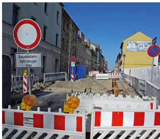
Großbaustelle Humboldtstraße: Für die umfangreichen Sanierungsarbeiten muss der Verkehr weiträumig umgeleitet werden. Das erfordert viel Geduld von Anliegern.