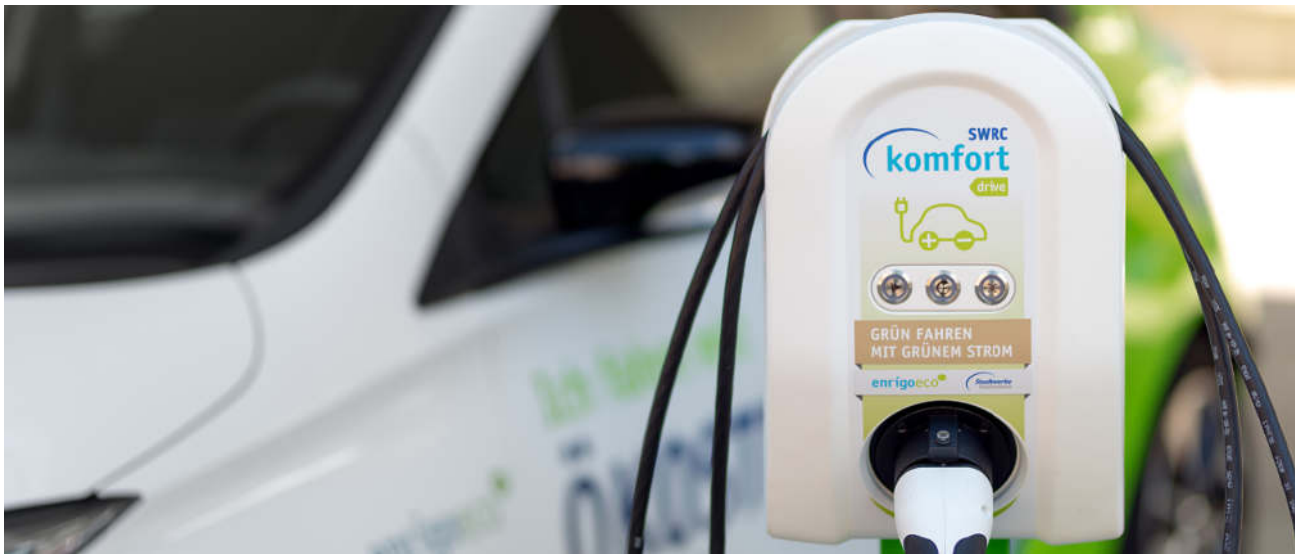
Control Basis HC11L-0 mit 11 kW Ladeleistung